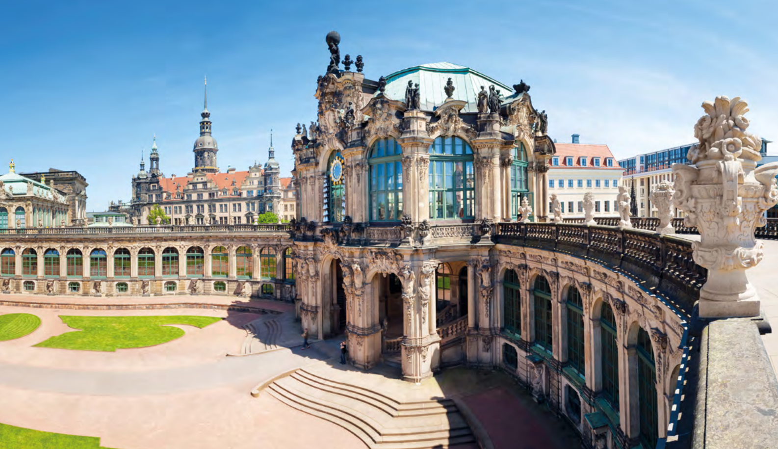
Le Zwinger de Dresde